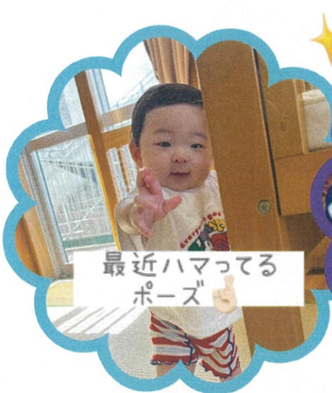
最近ハマってるポーズ👉

今週は、感触(氷)遊びをしたり、すみれ組(1歳児クラス)のおへやで遊んだり、デッキでシャボン玉をしたりと、毎日楽しいことがいっぱい！子ども達の笑顔が沢山見られました😊