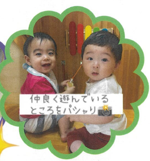
仲良く遊んでいるところをパツァリ📸